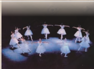
京都バレエシアターの作品 コッペリア、眠れる森の美女、シゼル、 くるみ割り人形、ラ・シルフィード 海賊、白雪姫、その他 名曲集